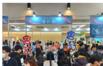
輔仁 — 輔人Open Day 熱鬧開箱 滿滿人潮

為聯繫各地區校友會，總計全球各地共成立 47 個校友會，包含：校友總會 4 個(全球校友總會、中華民國校友總會、北美校友總會、歐洲校友總會)、台灣地區 9 個、美加地區 15 個、歐洲地區 7 個、亞太澳洲地區 12 個。未來將持續推動校友會成立並藉由校友會運作及擴展，建立校友與母校之間溝通橋樑，促進校友彼此互動情誼，發揚輔仁之精神。