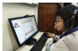
輔大學伴心繫偏鄉學童，通「網」他們的「路」