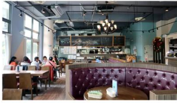
饗趣31 · 大湖公園旁親子友善餐廳 · 提供限定時段菜單 | 台北內湖