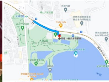
大湖公園捷運站二號出口 三分鐘抵達 饗趣31 義式餐廳 臺北市內湖區成功路五段31號