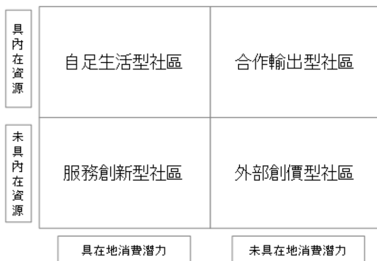
圖二 社會企業應用社區資源與社區創價之策略模式

由於外來的美術專業團隊，將農村閒置的房舍空間改變為藝術創作與展示的美術館社區，創造吸引外部消費者進入與消費的新社區價值，是一個外部創價的社區發展案例。