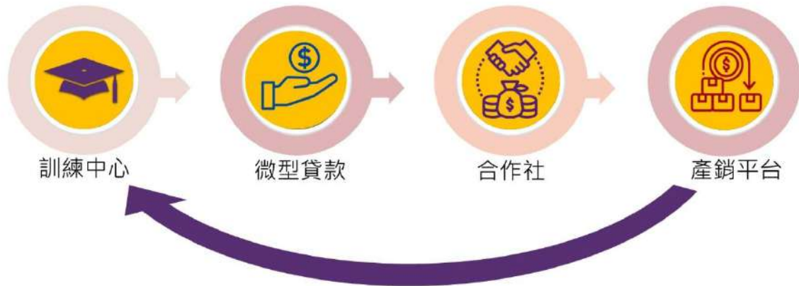
圖一 農村技術培訓示範學校的經濟開發目標