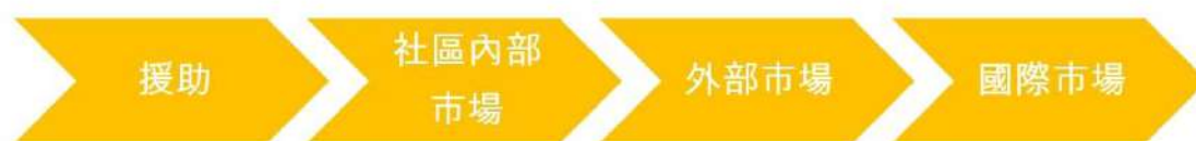
圖三 組織轉型策略演變階段

階段 4：社區合作社與國際市場開發—設立正式合作社，有組織的學習企業層次的品質管理與銷售供應服務，擴增外銷管道（咖啡與其他農產品、手工藝品等）